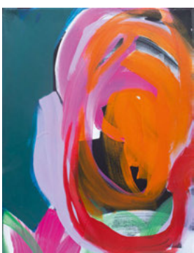
Faces & Figures No. 13, 2021, 40 x 30 cm, Acryl auf Leinwand