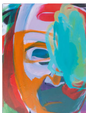
Faces & Figures No. 14, 2021, 40 x 30 cm, Acryl auf Leinwand