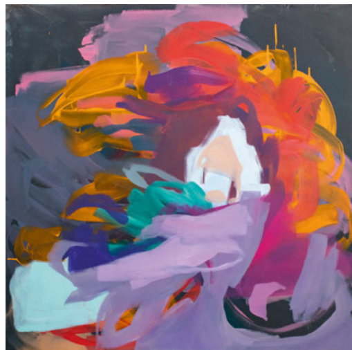
Visible No. 03, 2022, 100 x 100 cm, Acryl auf Leinwand