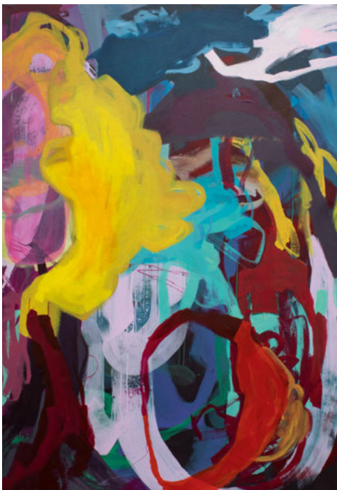
Landscapes No. 32, 2021, 195 x 135 cm, Acryl auf Leinwand

In ausgewählten Werken aus verschiedenen Serien zeigt sich ein Spiel von Verdichtung und Auflösung. Jedes Werk wird zum Spiegel essenzieller Zwischenräume, in denen sich das Wesentliche offenbart: die tiefe Verbundenheit menschlicher Existenz trotz – oder gerade wegen – ihrer Vielschichtigkeit.